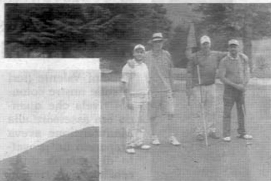
In alto e a sinistra, alcune fasi della gara che si sono confrontati sul tracciato a diciotto buche del prestigioso green fiuggino

vo. In questi anni l'Archigolf Cup è cresciuta tantissimo e siamo orgogliosi di quello che abbiamo fatto fino ad oggi». Il prossimo weekend sul green di Fiuggi offre ancora una due giorni ricca di emozioni. In calendario c'è proprio il trofeo Conca d'Oro. Lo spettacolo continua.