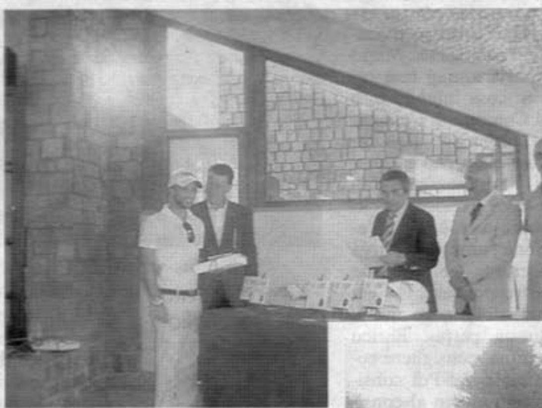
A sinistra, la cerimonia di premiazione della diciannovesima edizione dell'Archigolf Cup che ha visto la partecipazione di ottanta partecipanti