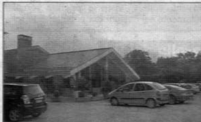
A sinistra, al lato e in basso la piscina dell'ex impianto Coni lasciata per anni nel degrado più totale

T ornerà in funzione a fine mese la piscina dell'ex impianto Coni a Fiuggi. L'azienda termale ha già avviato i lavori di sistemazione della struttura che da tempo era in condizione di abbandono e di totale degrado. L'intera area tornerà presto ad ospitare gli appassionati del nuoto, offrendo un servizio in più all'interno dell'impianto sportivo che comprende anche il campo da golf. In questi giorni si è cominciato a sistemare la vasca dove dovranno essere ripristinate tutte le pompe. Il rilancio della piscina è il prossimo obiettivo dopo la riapertura della fonte Anticolana, avvenuta sabato. Gli operai dovranno riqualificare l'intera area che ospita